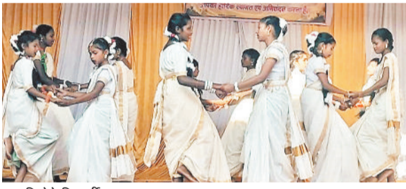
प्रस्तुति देते विद्यार्थी