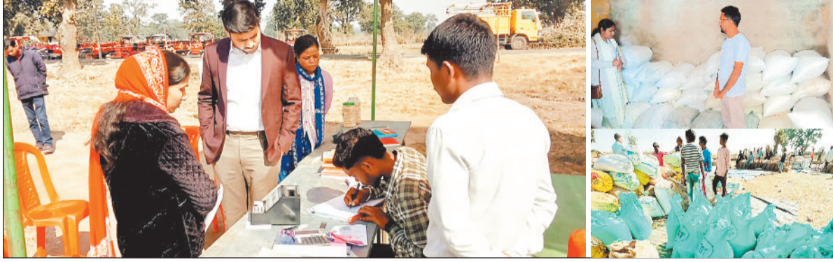
निरीक्षण करते अधिकारी।