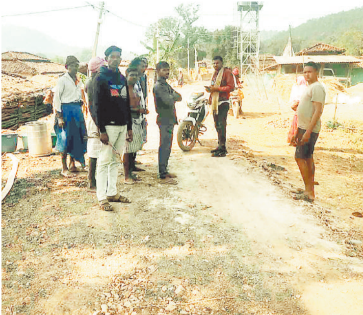
सड़क का निरीक्षण करते जनप्रतिनिधि व ग्रामीण।