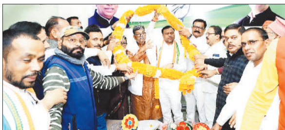
प्रदेशाध्यक्ष का महाभारत से स्वागत करते कांग्रेसी।