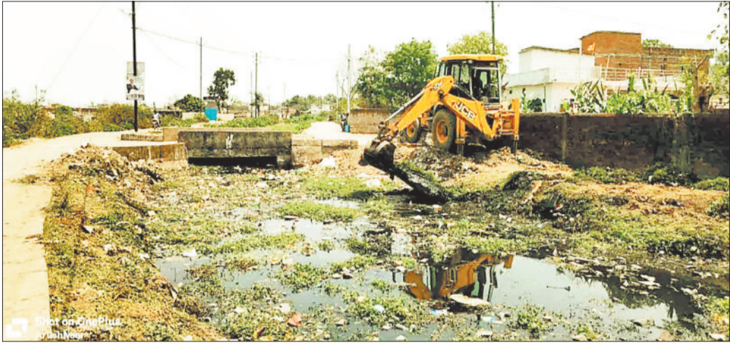
कचरे से ढाँट रही नहर।

तीन दशक पूर्व तक महामाया पहाड़ से सटे बड़े इलाके में सालोभर अच्छी खेती होती थी। किसानों को सिंचाई सुविधा प्रदान करने जल संसाधन विभाग द्वारा नहर बनाई थी तथा नियमित बाँकी बांध से पानी की आपूर्ति की जाती थी। सिंचाई जरूरतों को देखते हुए वर्ष 1990 में नहर का पक्कीकरण कराया था ताकि खेतों तक पर्याप्त पानी पहुंच सके। धीरे-धीरे शहर का विस्तार होता गया तथा खेतों में पानी आबादी बस गई। खेती बंद होने के कारण नहर की उपयोगिता लगभग खत्म हो गई है। इधर उपयोग बंद होने पर अब नहर कचरादान बन गई है। आसपास में निवासरत लोग नहर में ही घोरों का कचरा फेंकते हैं। नगर निगम ने भी नहर में शहर की नालियों को जोड़ दिया है जिससे शहर का गंदा पानी एवं कचरा भर गया है। नहर में चारों तरफ झाड़ियाँ उग आई हैं। नदिन दशकों से नहर का उपयोग गंदा पानी निकासी के लिए कर रहा है लेकिन कभी